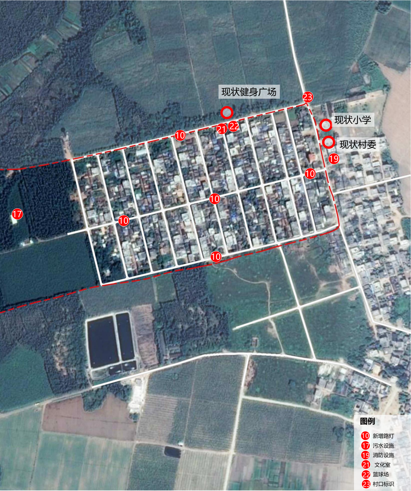
新城自然村村庄建设项目布局规划图