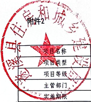
2026年县级项目支出绩效目标表