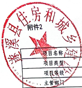
2026年县级项目支出绩效目标表