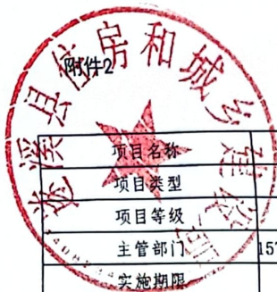
2026年县级项目支出绩效目标表