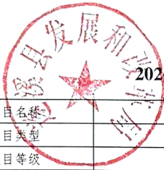
2026年县级项目支出绩效目标表