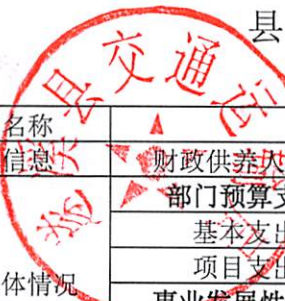
县级部门整体预算绩效目标申报表