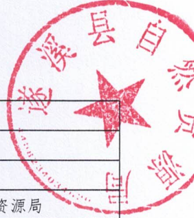
2026年县级项目支出绩效目标表