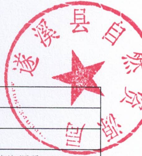
2026年县级项目支出绩效目标表