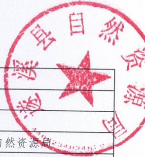
2026年县级项目支出绩效目标表