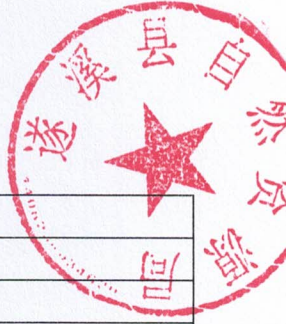
2026年县级项目支出绩效目标表