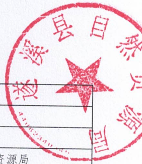
2026年县级项目支出绩效目标表