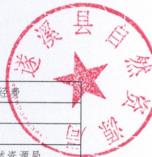
2026年县级项目支出绩效目标表