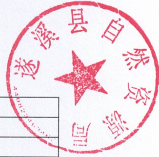
2026年县级项目支出绩效目标表