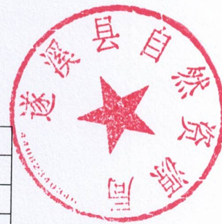
2026年县级项目支出绩效目标表