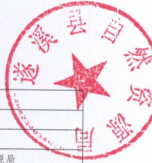
2026年县级项目支出绩效目标表