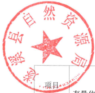
表 2. 遂溪县存量住宅用地信息汇总表