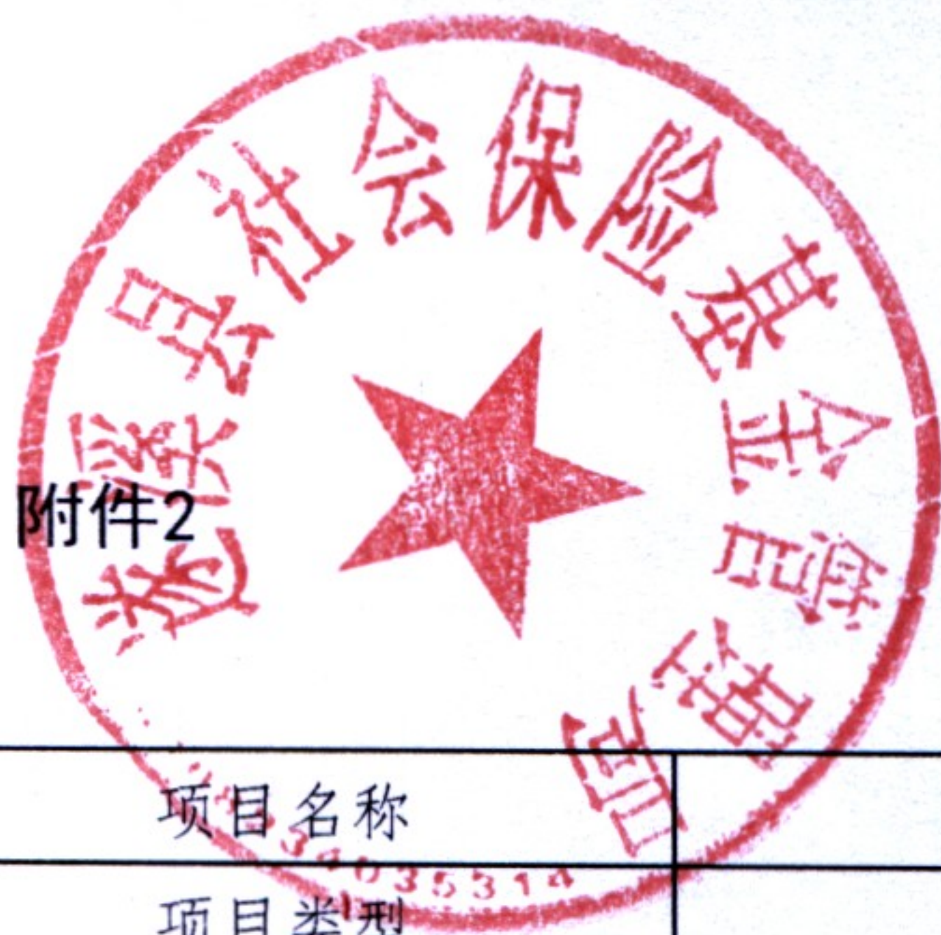
2025年县级项目支出绩效目标表