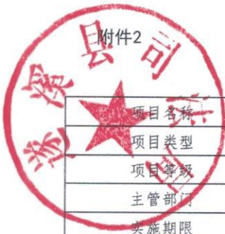
2025年县级项目支出绩效目标表