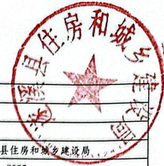
2025年县级项目支出绩效目标表