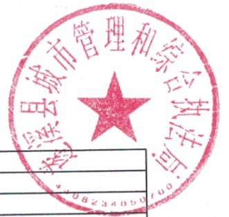
县级项目支出绩效目标表