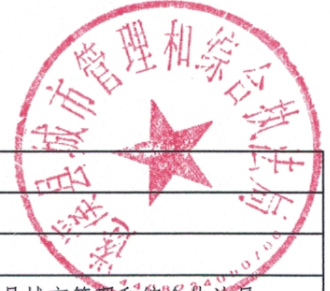
2025年县级项目支出绩效目标表