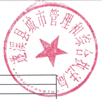
县级项目支出绩效目标表