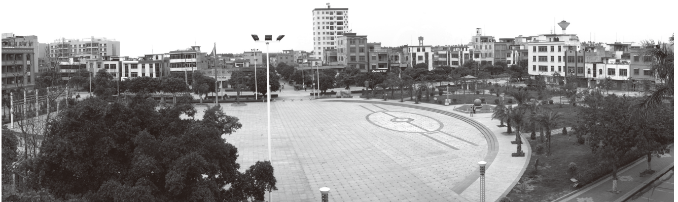
▲北坡镇全民健身文化广场

【加大视频监控网建设】 2013年，遂溪县进一步健全基础防范网、情报信息网、视频监控网、网络监控网、打击整治网、区域协防网“六张网络”，完善街面防控网、社区防控网、单位内部防控网、区域协作网、网络社会防控网“五张网络”，构建现代化的立体治安防控体系，加快治安视频监控系统建设。是年，一类视频监控系统建设方案经县四套班子会议通过，全县共安装二类监控镜头1548个，完成率108%，已全部通过市验收。