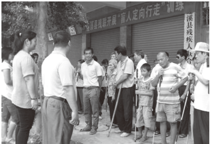
▲ 2013年8月25日，市残联到县残联举行盲人定向培训班

【提高劳动就业】 2013年，县残联采取分层次培训、集中培训、岗位培训等多种方式，提高残疾人技能水平。全年送5名贫困残疾人到省、市参加各类技能培训班2期；安排残疾人到深圳富士科技集团公司、江门大长江集团