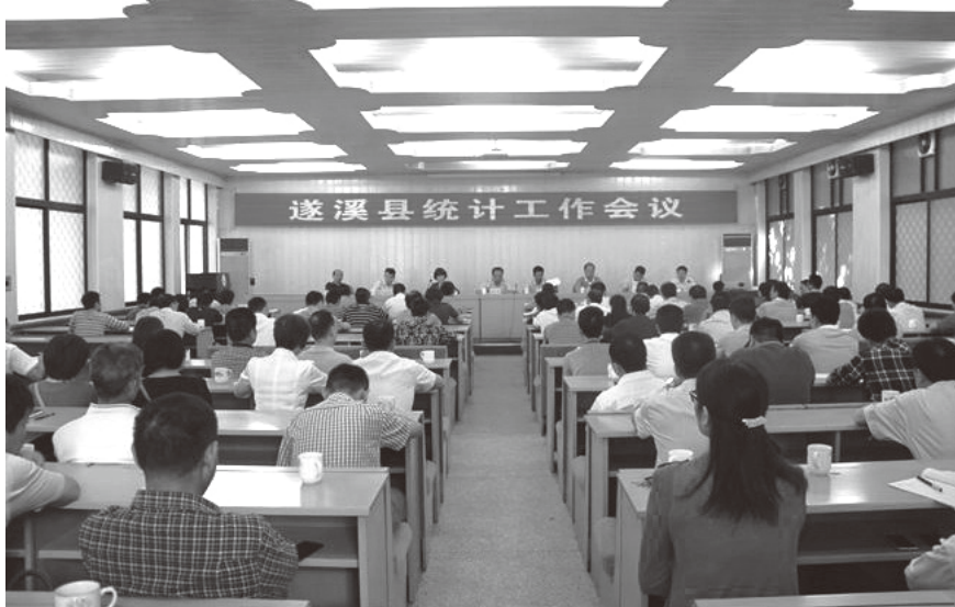
▲ 2013年11月4日,遂溪县统计工作会议在县委第一会议室召开

【耕地保护】 2013年,遂溪县耕地面积为149.54万亩,基本农田保护区调整划定面积136.09万亩,均超过市政府达的任务指标。加大补充耕地力度,共完成园地山坡地开发补充耕地项目11个,