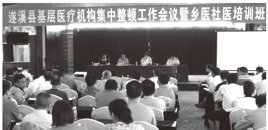
▲ 2013年8月18日，在遂溪皇家国际酒店举办遂溪县基层医疗机构集中整顿工作会议暨乡医社医培训班

食品卫生工作 2013年，县疾病预防控制中心对2070位食品从业人员进行体检，检出“五病”人员27人，“五病”调离率100%；委托食品检验48份，合格43份；食具监测1585份，合格1502份。5月在9个镇36个行政村300家居民户进行了300份食盐碘含量监测，其中加碘盐297份，合格碘盐288份，