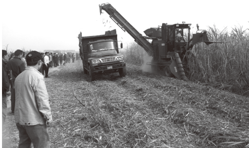
▲ 2013年3月8日，在北坡镇举办甘蔗收获机械化演示会现场

2012年跨2013年榨季糖业生产工作从2012年12月6日开始到2013年3月19日结束，历时104天。通过全县上下的共同