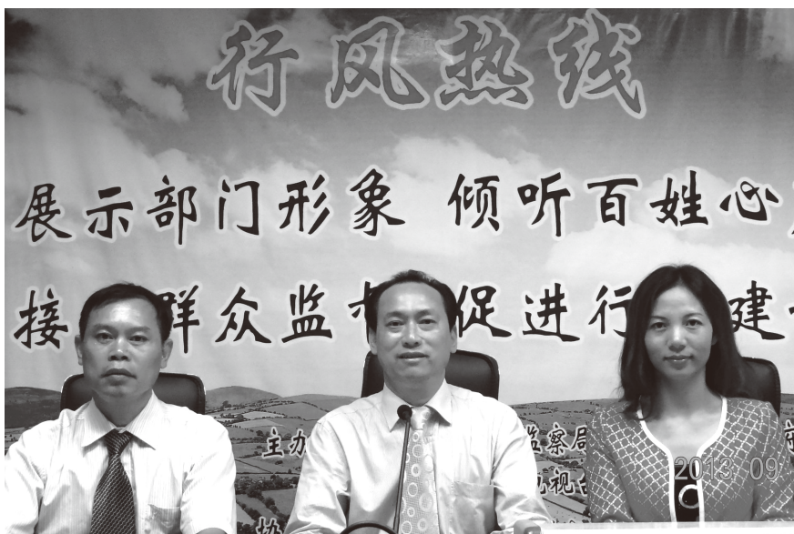
2013年9月24日，县房产管理局《行风热线》上线工作顺利进行

【供水设施建设】 2013年，县自来水公司开展遂溪县城自来水建设工作，筹资1200多万元（其中争取国家专项扶持资金560万元）建设《遂溪县城自来水制水系统扩改工程项目》扩建部分工程，该工程已于2013年1月份开始动工建设，截至2013年底已完成工程总量64%，力争2014年6月份前竣工投入使用；筹资建设《遂溪县城新城区供水管网建设工程》，该工程争取的国家专项扶持资金200万元已下达到县财政局，力争2014年8月份开始动工建设；筹资370多万元