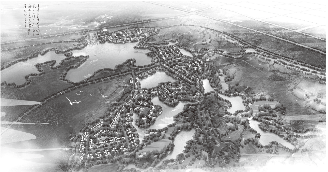
▲广东湛江养老休闲产业基地——玥珑湖生态城首期修建性详细规划鸟瞰图

距离遂溪县城约3公里的内塘水库地块，区位优势明显，气候环境宜养宜居宜游。项目总投资约131亿元，分两期建设，一期投资预计57亿元，规划总建筑面积158.65万平方米，二期投资预计74亿元。建设期限为6年，占地面积约8000亩（533.33公顷），水库面积约为2300亩（153.33公顷），以休闲小镇的形式建设，建设内容涵盖现代养老养生、休闲度假和商务、休闲运动、生态人居、雷文化艺术展示、成长教育、养老养生研究等，主要目标是打造湛江城市的CRD（中央游憩区），塑造全国休闲养老宜居胜地和中国休闲养老产业的典范。