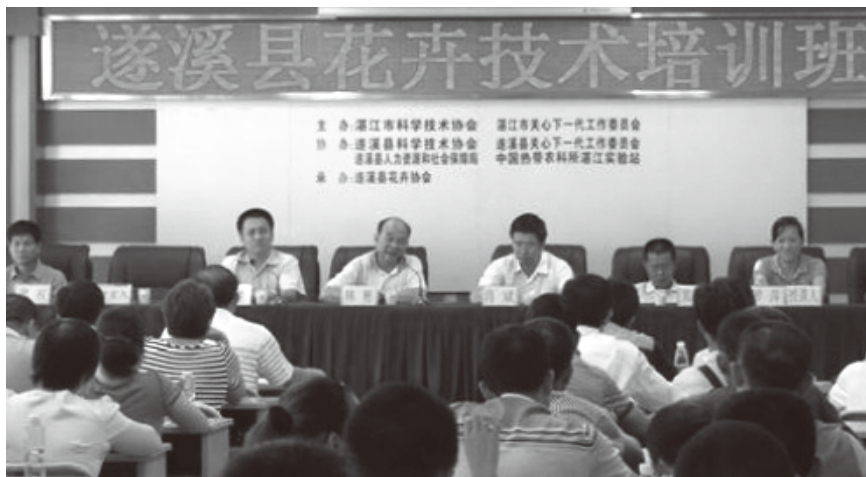
▲ 2013 年 6 月 28 日,与市科协、中国热带农科院湛江实验站在遂溪县联合举办湛江市科普及农(遂溪)花卉技术培训班

【配合相关部门开展科普活动】2013 年,县科协配合县安监局开展“防灾减灾”安全知识科普宣传咨询活动,印发科普资料 3000 余份;协同县工商局、县卫生局、县食品药品监督管理局等单位开展食品安全周活动,发放科普资料 2000 多份;配合各商业银行开展人民币知识宣传活动等。