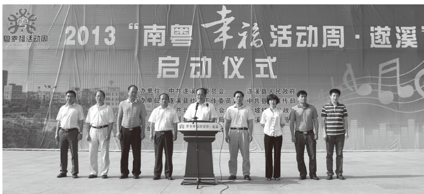
▲ 2013 年 9 月 26 日，2013 “南粤幸福活动周·遂溪”启动仪式在北坡镇健身文化广场举行

【民情志愿服务队伍建设】 2013 年遂溪县在全市率先建立县、镇两级社工委联络员制度，由联络员兼任县民情志愿服务队员，负责本单位、本领域民情信息收集和报送民情信息的收集，此举既壮大了民情志愿服务队伍建设，也拓宽了收集社情民意的来源渠