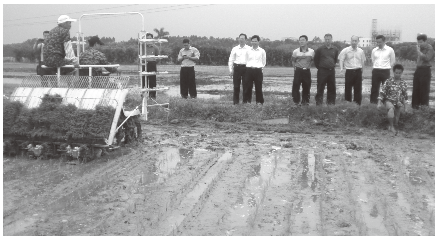
▲ 2013年3月27日，在遂溪镇新桥举办插秧现场会

县于2013年8月初举办普查培训培训班进行技术培训和普查动员，正式拉开了农产品产地土壤重金属污染防治普查工作序幕，全县普查耕地面积168.3万亩，采集土壤样本1984个，于12月中旬全部完成了土壤采样任务。