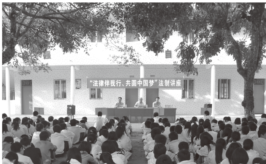
▲ 2013 年 10 月 30 日，县普法办和县司法局在乌塘中学举行法制讲座

社区矫正 2013 年，县司法局继续巩固社区矫正信息监管平台优势，创新社区矫正监管模式，进一步加强与公、检、法三个相关职能部门的工作配合，以社区矫正股和司法所为依托，实施精确定位实时监控，使矫正人员的监管由人防到技防，并实现“三清一迅速”（人头清、监管类别清、矫正时间清，联系迅速）。在规范执法方面，通过社区矫正，考虑矫正对象的心理状态，适度满足他们希望与社会、家人沟通