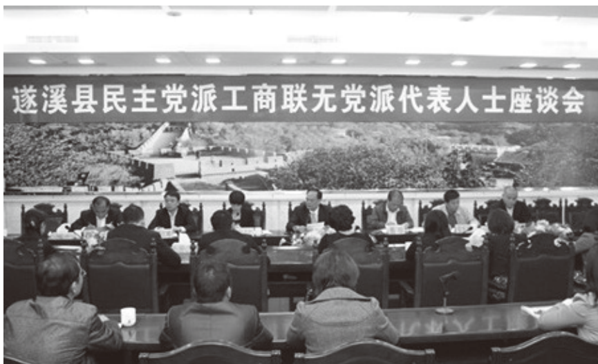
▲ 2013年4月11日，中共遂溪县委在县委第二会议室召开“遂溪县民主党派工商联无党派人士座谈会”

【为发展出谋献策】 参政议政，民主监督和政治协商是民盟的基本职能。2013年“两会”前后，民盟县委积极组织担任县政协委员和人大代表的盟员深入吴川市、雷州市、遂溪县北坡镇调研，撰写提案、议案，始终如一地关注遂溪发展中的重点、难点问题和民生问题。2013年民盟盟员有三份提案被县评为年度优秀提案。这充分体现了民盟“立盟为公，参政为民”的政治信念，体现了多党合作事业中民盟的自身价值和党派作为。盟县委副书记