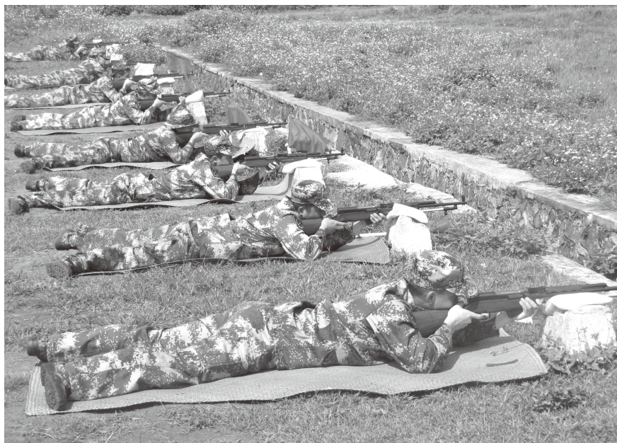
▲ 2013年9月，遂溪县民兵分队进行56式半自动步枪实弹射击练习

军事斗争准备 紧紧围绕“能打仗、打胜仗”这一强军之要，加强军事斗争准备。根据形势和任务变化，修改完善各种作战方案和应急处突预案；按照实