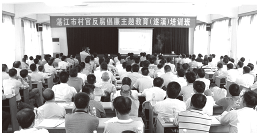
▲ 2013年8月22—23日，湛江市村官反腐倡廉主题教育（遂溪）培训班在遂城镇政府开班

【发挥黄学增廉政教育基地的作用】 2013年，县纪委邀请深圳市著名歌手李国辉、杨乐到遂溪县拍摄《你是一颗流星——黄学增》音乐电视。组织全县各镇、县直机关单位党员和机关工作人