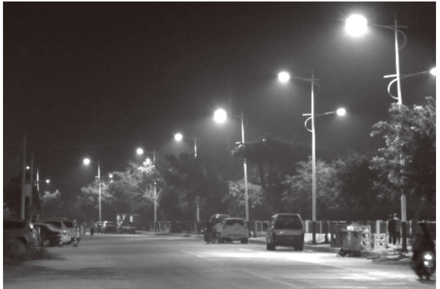
▲河滨路 LED 灯亮化工程

【市政设施建设和维护】 2013 年，县公用事业管理局紧紧围绕县委、县政府下达的 2013 年十大民生项目工程和重点市政工程任务，全面推进市政园林绿化建设管理和各项工作开展，推进市政建设和县城环境的改善，确保各项工作任务地完成。是年，文化广场改造工程投入 120 万元，改造面积 2 万平方米；垃圾中转站和公厕建设完成总投资 210 万元，其中土建部分 70 万元、设备部分 80 万元、国有原有土地部分 60 万元，准备施工；投入 75 万元，组织 100 人次清理改造了县城 200 座雨水井，抢修中山路路段下水道（重点在西溪河出水口段）以及几次清淤疏通维修县城市政设施，前前后后（包括台风前后）修复工程一大批，确保街道排水通畅；投入 44 万元进