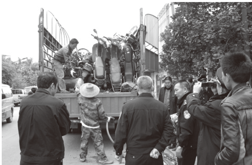
▲ 2013年1月9日，遂溪县工商局率多个工商所执法人员到城月镇捣毁五个涉嫌非法拼装摩托车黑窝点。图为执法人员查获非法拼装摩托车

【完善“12315”消费维权体系，健全消费维权网络】 2013年，遂溪县建立红盾维权服务工作站277个，聘请维权监督员或志愿者1000多人，在大中型企业、商场、市场等建立“12315”维权联络站28个，在移动公司等6家大型服务企业设立消费者纠纷和解工作联络站。举办纪念“3·15国际消费者权益日”现场活动，联合遂溪县电视台、湛江新闻网遂溪站对被评为2012年至2014年度湛江市消费者“诚信单位”的22家企业和遂溪县消费者“诚信单位”的56家企业进行典型新闻采访宣传报道和推介。2013年全县消委系统受理消费者投诉案件108宗，调解成功100宗，为消费者挽回经济损失16.8万元，消费者直接获赔9.8万元；参与县人民法院诉前联案件3宗；接受消费者来人来电咨询投诉1314人次。