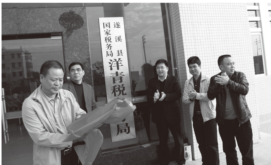
▲ 2013年1月16日,遂溪县国税局洋青稅务分局综合业务楼落成正式启用

【依法治稅】 一是开展2013年经济稅源调查,建立重点项目建设等基础资料 and 数据库;二是与公安部门联合加强车船稅核查工作,对该辖区内稅务部门、代收代繳单位和委托代征单位2012年度征收车辆车船稅情况进行全面检查;三是继续开展私人建房稅收清理、土地增值稅清算工作,并研