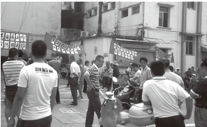
▲ 2013年10月16日，权属企业下岗职工到县委进行上访。图为县国资公司领导及干部职工正在对上访的下岗职工做细致的思想工作

【安全生产】 2013年，县国有资产经营公司高度重视安全生产工作，认真参加县政府各类安全生产工作会议，会后能迅速传达和贯彻落实会议精神。并将安全工作纳入公司的重点工作，明确责任、工作任务，与其他工作同安排、同部署、同落实。公司与县