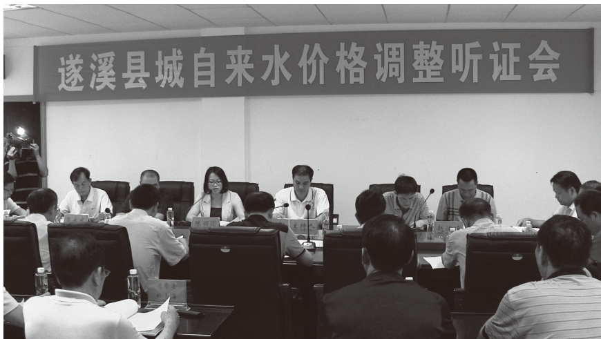
▲ 2013年5月16日，召开县城自来水价格调整听证会

“收费许可证”3个；并完成对全县各行政事业单位和经营服务性单位的收费及政府性基金年审。