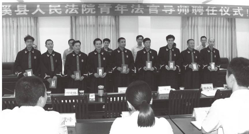
▲ 2013年9月17日，县法院举办首届青年法官导师聘任仪式

2013年，全县受理各类案件3746件，同比上升23.8%，办结3727件(含旧存)，审限内结案率99.49%。其中以调解撤诉方式结案2276件，调撤率61%，同比上升10.5%；法官人均结案75件，排名全市法院系统第一；反映审判质量的一审案件发改率2.59%，同比下降1.05%。完成