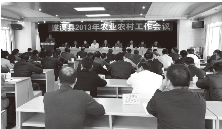
▲ 2013 年 2 月 22 日，遂溪县 2013 年农业农村工作会议在北坡镇召开