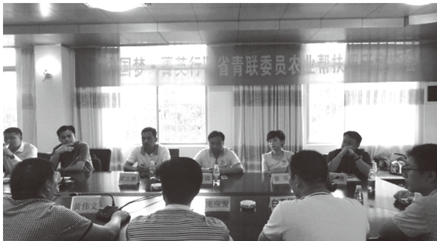
▲ 2013年8月24日，遂城镇召开“中国梦·菁英行”省青联委员农业帮扶调研座谈会

亿元，同比增长14.1%。其中，第一产业增加值12.7亿元，同比增长6.2%；第二产业增加值15.6亿元，同比增长17%；第三产业增加值27.1亿元，同比增长16.1%。农民人均纯收入6521元，同比增长8.4%。国地两税收入3.96亿元，同比增长12.2%。固定资产投资39.2亿元，同比增长30.1%。参加城乡居民医疗保险157254人，覆盖率100%；城乡居民养老保险参保44540人，覆盖率90%。