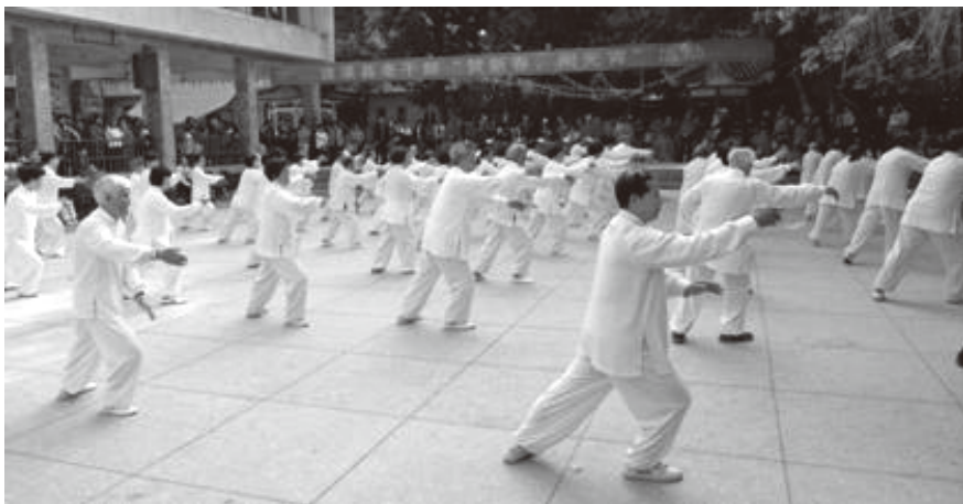
▲ 2013 年 2 月 22 日，遂溪县老干部“贺新春闹元宵”活动在遂溪县老干部活动中心举行。图为老干部太极拳队的一组表演节目

城乡建设步伐加快 2013 年，遂溪县投入 368 万元，对县城滨河新区 13.6 平方公里进行编制控规；改造完成县文化广场；动工兴建人民北路、银河小区、垃圾中转站和东圩河改造等市政工程；加快推进县体育馆（醒狮广场）建设；投入 1.75 亿元，改造恒兴花园、工会大厦等 16 个“三旧”项目。投入 8465 万元，进行电网改造，完成供电量 9.2 亿千瓦时。投入 730 万元，扩改县城供水管网二期 1.5 万米。投入 9168 万元，新（改）建各级公路 192.8 公里。全面完成“一