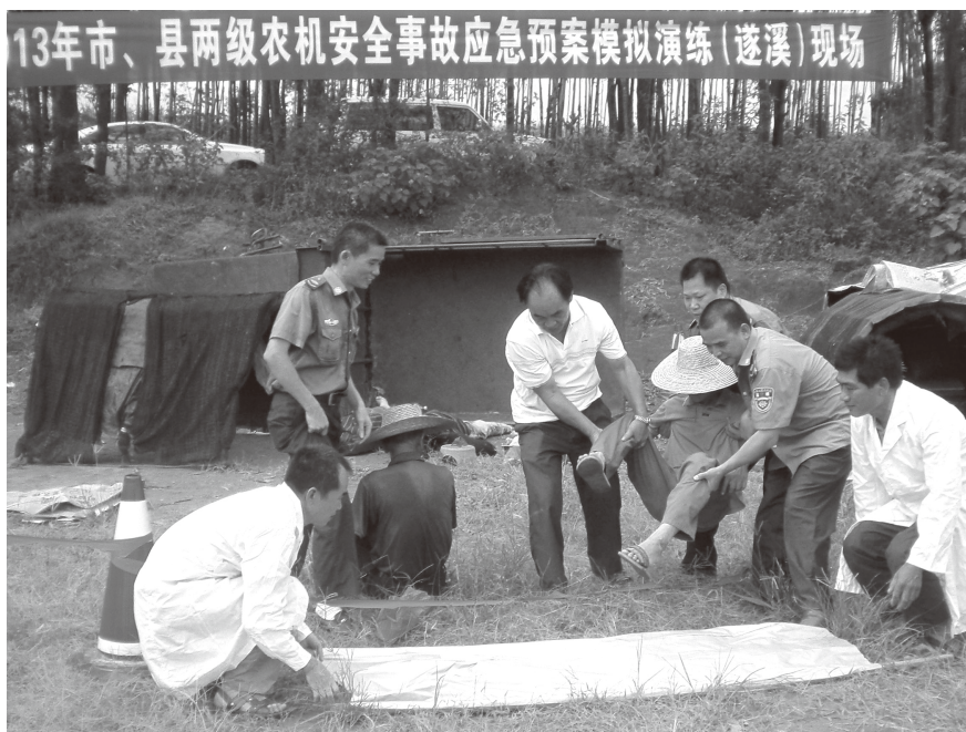
▲ 2013年6月24日，农机安全事故应急演练现场

【农机购置补贴】 2013年遂溪县完成中央财政购机补贴资金1087万元，受益农民381人次，购买各类农业机械共5134台