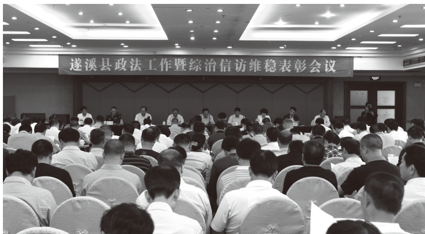
▲ 2013年3月21日，遂溪县政法工作暨综治信访维稳表彰会议在松源酒店召开

【平安遂溪创建】2013年，遂溪县政法委注重加强社会资源整合，以点带面，推进平安建设铺开。一是抓试点力度大。集中力量指导遂城镇开展平安创建试点工作，安排镇班子和部门分片包干挂点指导，实行遂溪县60个综治委成员单位挂点村（居）委会联系指导工作制度，通过集民资、汇民智助推平安建设。2013年各挂点单位落实支持资金100多万元，购买治安巡逻警用摩托车58辆和警用自行车300辆。