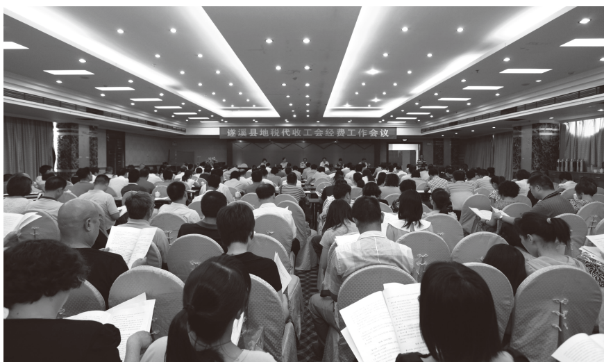
▲ 2013年7月9日，遂溪县地税代收工会经费工作会议在松源酒店召开

【完善金融服务体系】 2013年，遂溪县加大金融机构发展力度，加快发展新型金融组织，逐步完善金融服务体系。至2013年底，全县有银行8家，保险公司2家，小额贷款公司1家。全县中小微企业获得银行融资89户，累计融资85.5亿元。办理企业跨境贸易人民币结算1.15亿元。优化城乡金融资源配置，深入开展助农取款服务点建设工作。至2013年底，全县银行业金融机构网点覆盖全县15个乡镇，254个行政村，建立助农取款服务点263个，覆盖率达100%。