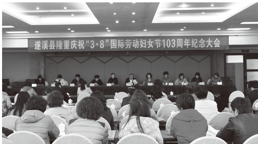
▲ 2013年3月5日，遂溪县隆重庆祝“3·8”国际劳动妇女节103周年纪念大会在松源酒店召开

【妇女儿童发展新规划】 2013年，遂溪县妇联充分发挥妇儿工委办公室作用，强化政府责任，加强统筹协调，全面推进“两个新规划”的颁发实施。一是开展多媒体编制总结妇儿规划十年跨越成果影展，创造性地总结前十年实施成功经验，确保县政府在2013年5月10日颁发《遂溪县妇女发展规划（2011—2020年）》《遂溪县儿童发展规划（2011—