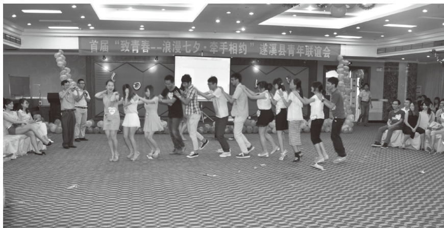
▲ 2013年8月10日，团县委举办首届“致青春——浪漫七夕·牵手相约”遂溪县青年联谊会