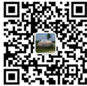
遂溪应急预警中心